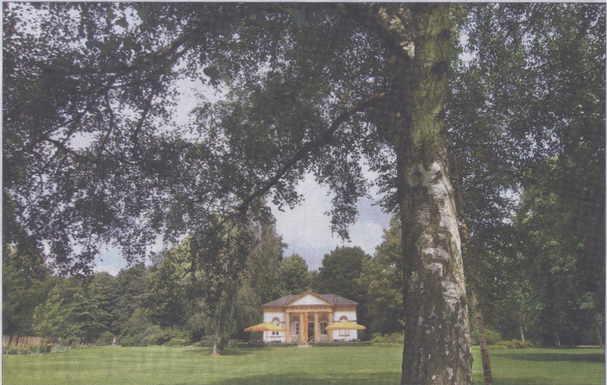
Der Nordpark mit seinem Pavillon im Schinkel-Stil gilt laut Universitätsstudie als eine Oase der Ruhe, unbelastet auch von Luftverschmutzungen.