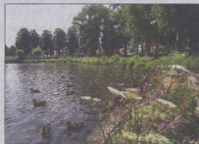
Sieht idyllisch aus, ist aber erheblich von Verkehrslärm belastet: der Grünzug Meierteich