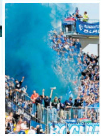
Der Auslöser: Order suchten im Block den Rauchbombenwerfer.