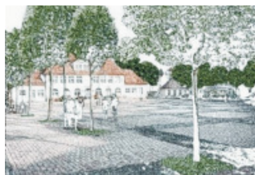
Mit viel Grün: So wäre der Siegfriedplatz für viele noch attraktiver als ohnehin schon. PROJEKTIONEN: UNI