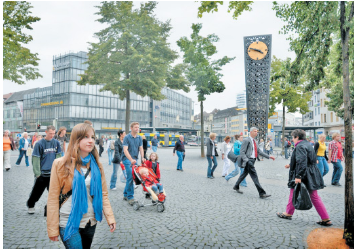
Es grünt so grün: Mit viel Arbeit am Computer schuf der Fotograf einen besonderen Jahnplatz. Im wirklichen Zustand aber schneidet der meistfrequentierte Platz der Stadt in einer aktuellen Umfrage am schlechtesten ab.