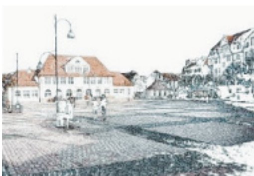
Grau in grau: So sähe der Siegfriedplatz ohne Bäume aus. Wenig einladend, finden die Befragten.