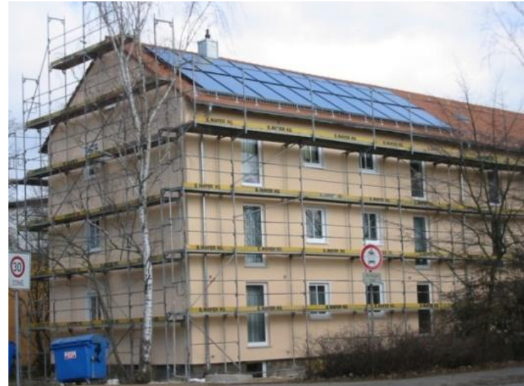
Umfassend energetisch saniertes Wohngebäude mit Solarwärmanlage