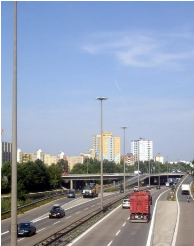
Hohes Verkehrsaufkommen und hohe Wohndichte in unmittelbarer Nähe zueinander