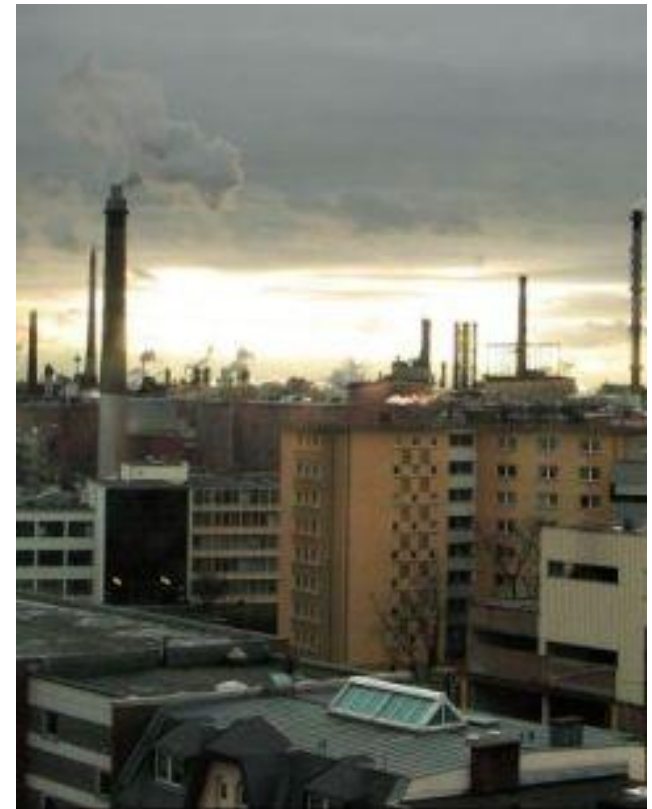
Wohnhäuser in der Nähe des Chemieparks Leverkusen,