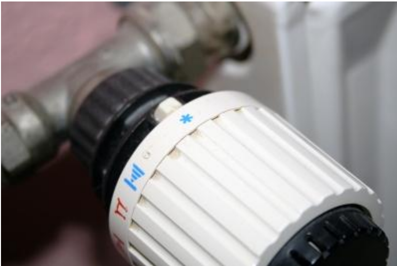
Heizen wird immer teurer, Bild: Daniel Gast, pixelio.de

Energetische Sanierungen nutzen Klima- und Gesundheitsschutz!