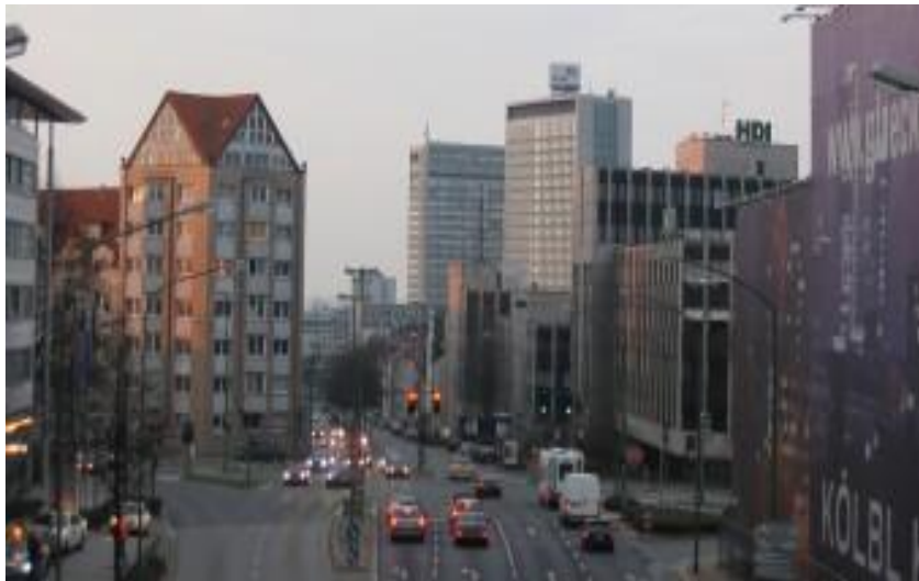
Völlig versiegelte Innenstadt in Essen