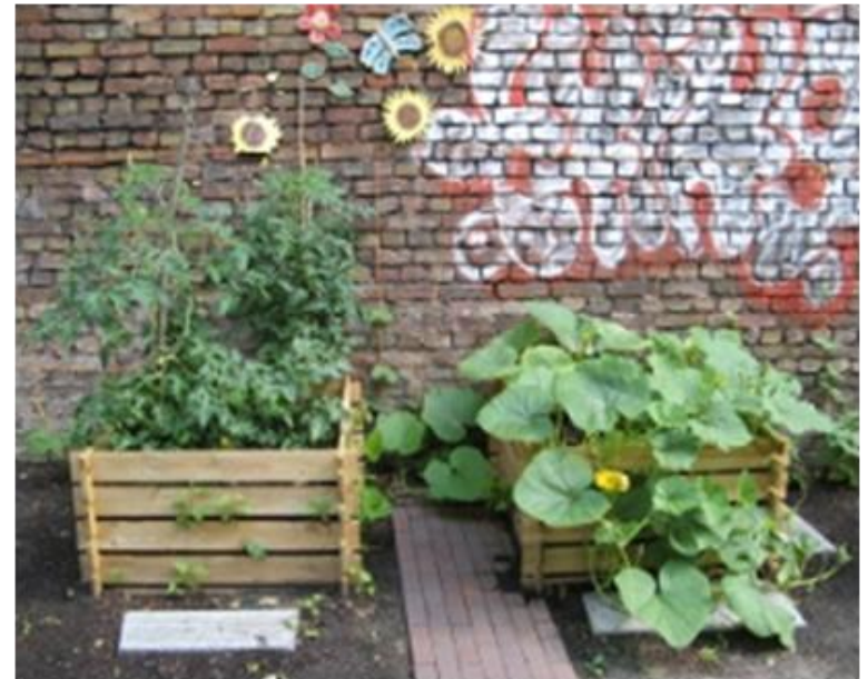
Generationengarten Berlin-Kreuzberg