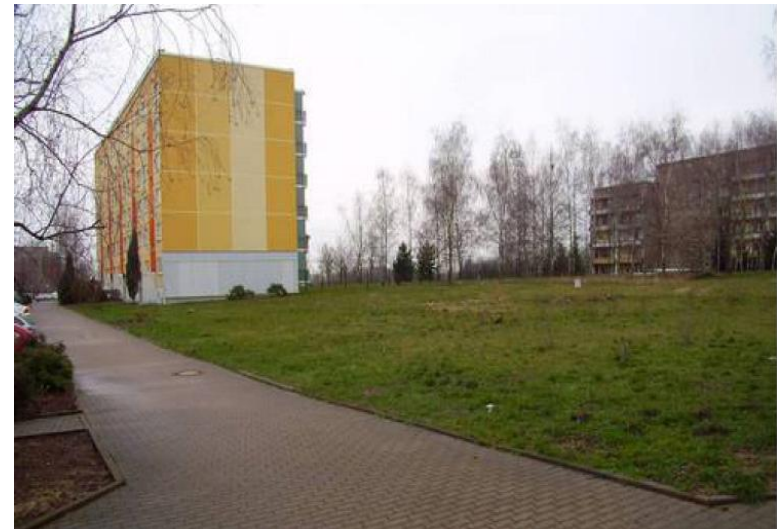
Abstandsgrün ohne Nutzwert, Bild: Grünplan Hoffmann, Freiraumplanung Hutholz-Garten