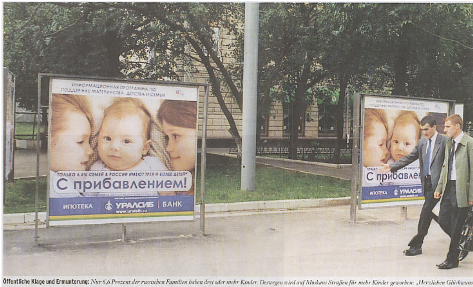
Öffentliche Klage und Ermunterung: Nur 6,6 Prozent der russischen Familien haben drei oder mehr Kinder. Deswegen wird auf Moskaus Straßen für mehr Kinder geworben: „Herzlichen Glückwunsch“