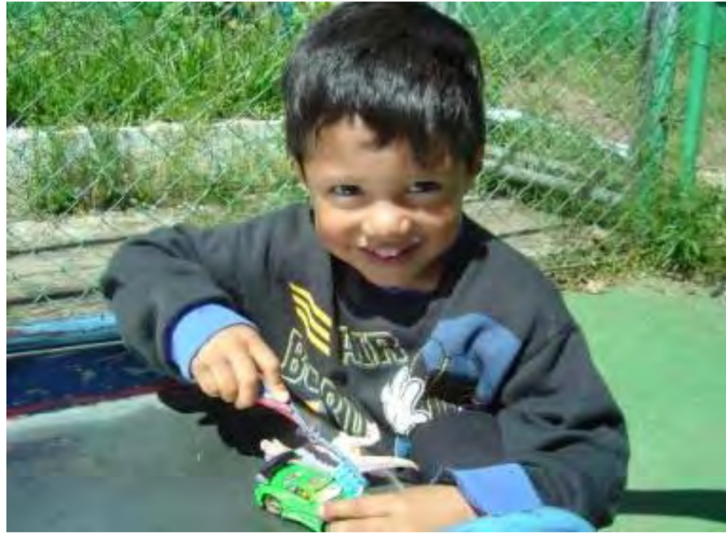
Los niños – nuestro futuro

La Asociación para el Desarrollo Comunitario Integral (ADECI) trabaja en el campo preventivo en un barrio periférico y muy pobre de la Ciudad de Guatemala donde el problema de las maras es muy grave. Al anochecer, la gente tiene miedo de salir a la calle – y con razón – ya que han habido muchos asesinatos en los últimos años; los mareros extorcionan a los pobladores y difunden miedo en el vecindario. La tasa de homicidios ha aumentado hasta un 120% en los últimos 7 años.