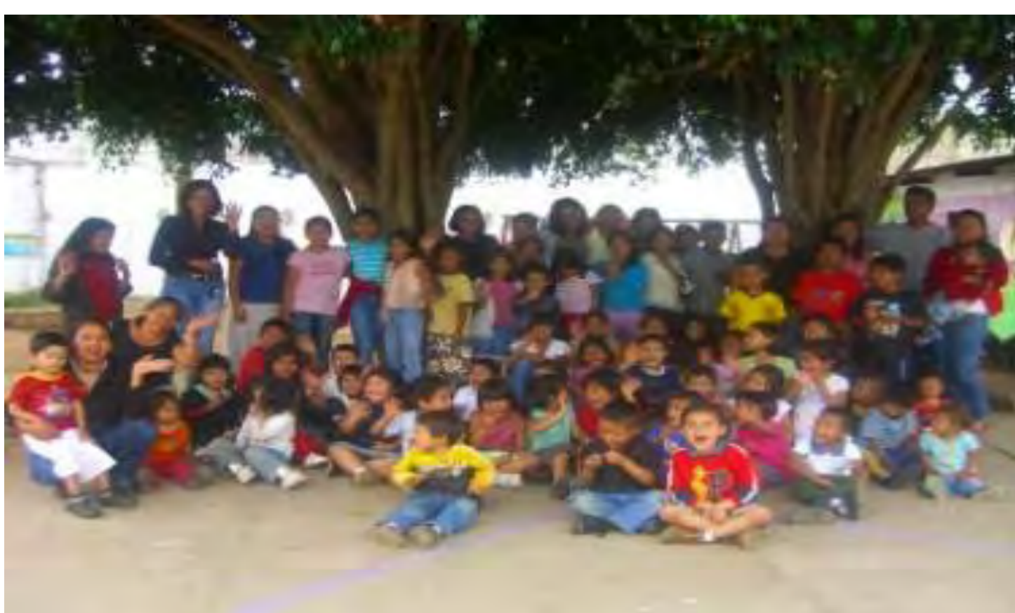
Los niños de ADECI

Se ha inaugurado una biblioteca ya que muchas veces los niños no tienen ni un libro en casa. Con los libros a su alcance los niños reciben un acceso a la educación. En el futuro ADECI pretende brindar mayores posibilidades ofreciendo los servicios de una sala cuna y un programa de talleres diferentes para los jóvenes para que tengan mejores perspectivas en su vida y no tengan la necesidad de entrar a las maras.