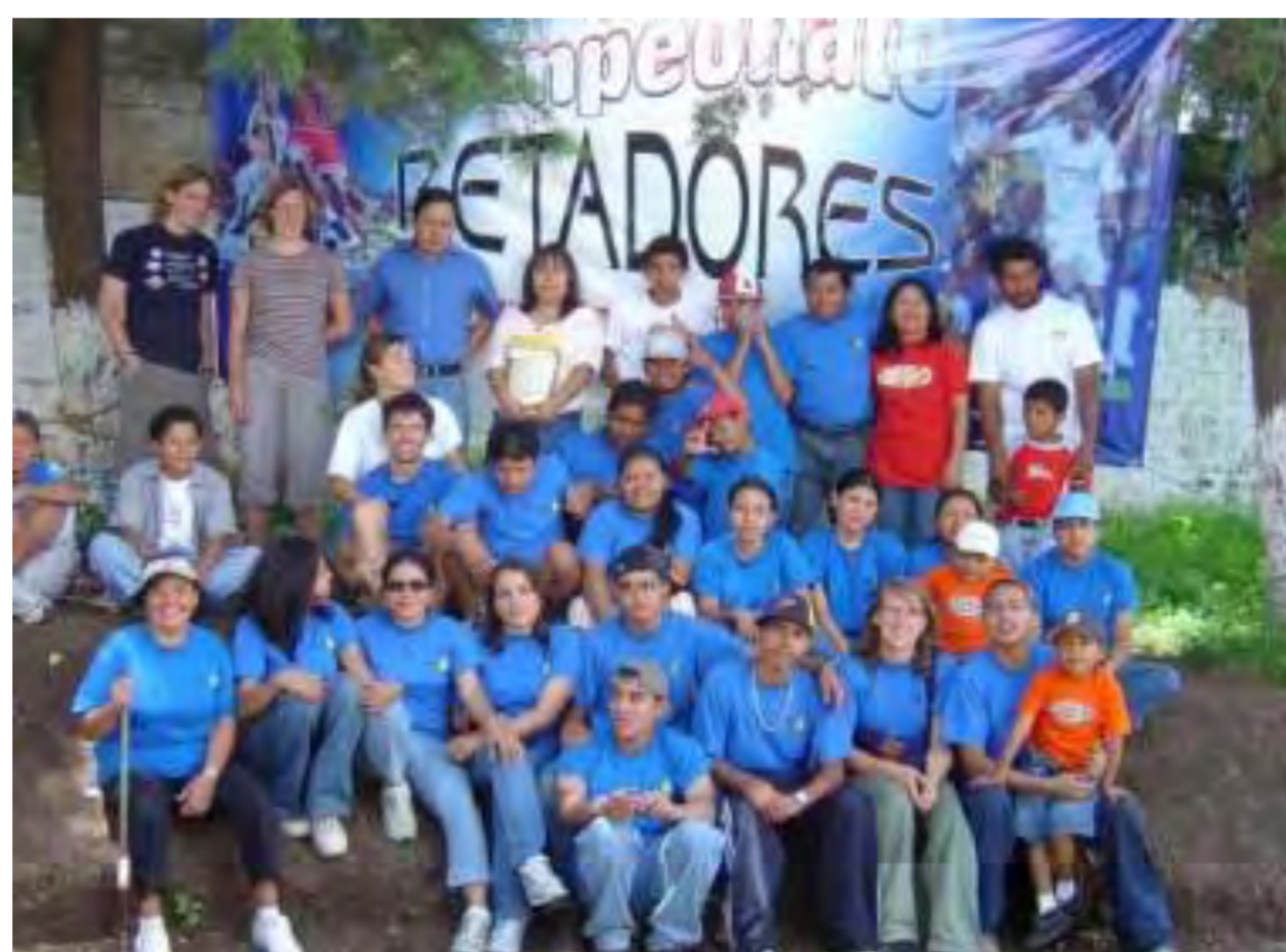
Los RETADORES – el equipo de voluntarios

Existe otro programa preventivo de ADECI que se enfoca especialmente en los jóvenes. Se les ofrece alternativas de diversa índole para fomentar la participación y evitar su inserción en las maras. Con un gran equipo de voluntarios ADECI ha organizado un campeonato de fútbol y de baloncesto. Hace poco participaron hasta 42 equipos . Los jóvenes y niños estaban muy emocionados y el programa ha sido un éxito total. Asimismo han organizado varias actividades como campamentos, excursiones y la marcha por la paz en el barrio. De esta manera se involucran no sólo a los niños y jóvenes, sino también a sus familias y a la comunidad en general. Está demostrado que una comunidad que permanece unida y con su tejido social fortalecido, tiene poder para enfrentar mejor a las pandillas y la violencia.