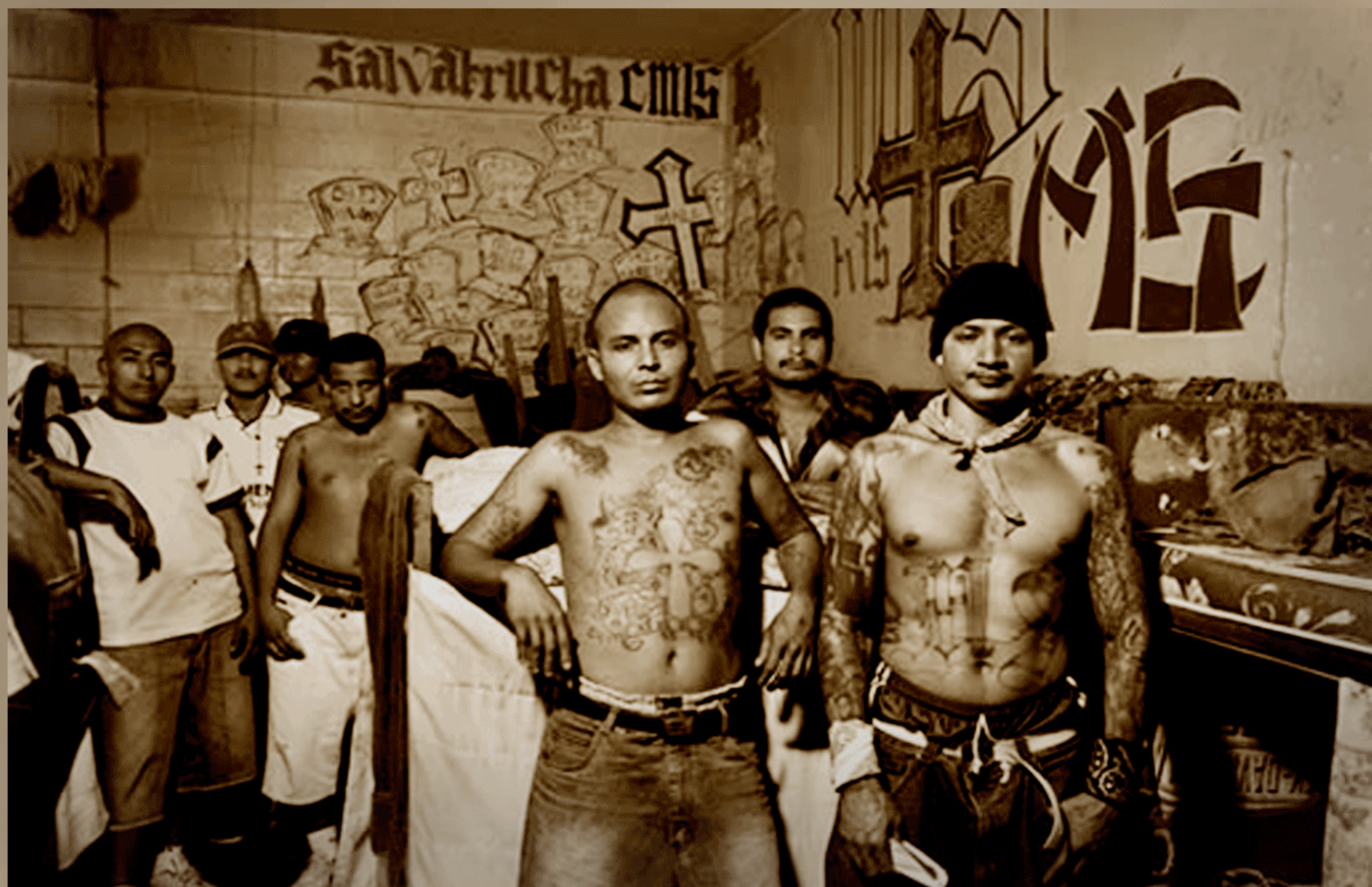
Mareros pertenecientes a la Mara Salvatrucha

¿Quiénes son? Las maras - pandillas callejeras criminales (las dominantes: Mara Salvatrucha y Mara 18)