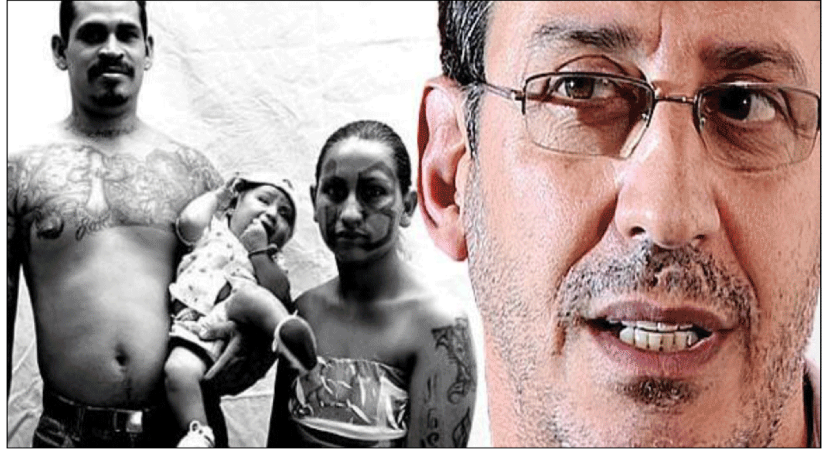
Christian Poveda: director de la película „la vida loca“, una película sobre las maras. Después del rodaje fue asesinado por las maras