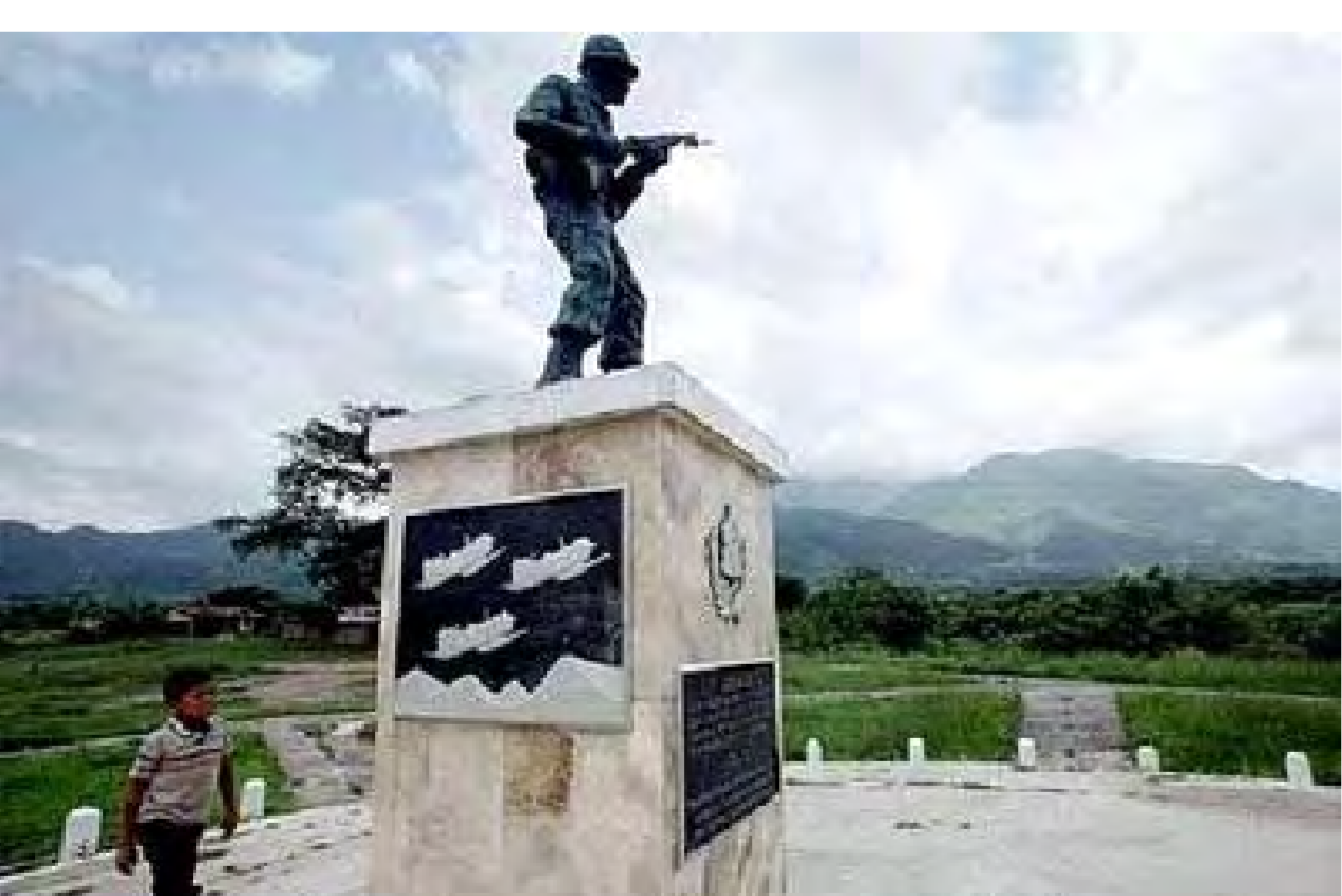
Monumento a los soldados caídos durante la Guerra del Fútbol (en Nueva Ocotepeque, Honduras)

Desde 1969 existía una guerra entre Honduras y El Salvador conocida como la "Guerra del Fútbol", la misma que se originó porque la gente de Honduras responsabilizaba a los refugiados salvadoreños del debilitamiento de su economía. Estos conflictos duraron hasta 1980, año en el que El Salvador estaba en manos de un gobierno militar y se inició la guerra civil a raíz del asesinato del crítico Óscar Romero (arzobispo) (1980-1991: 70000 muertos).