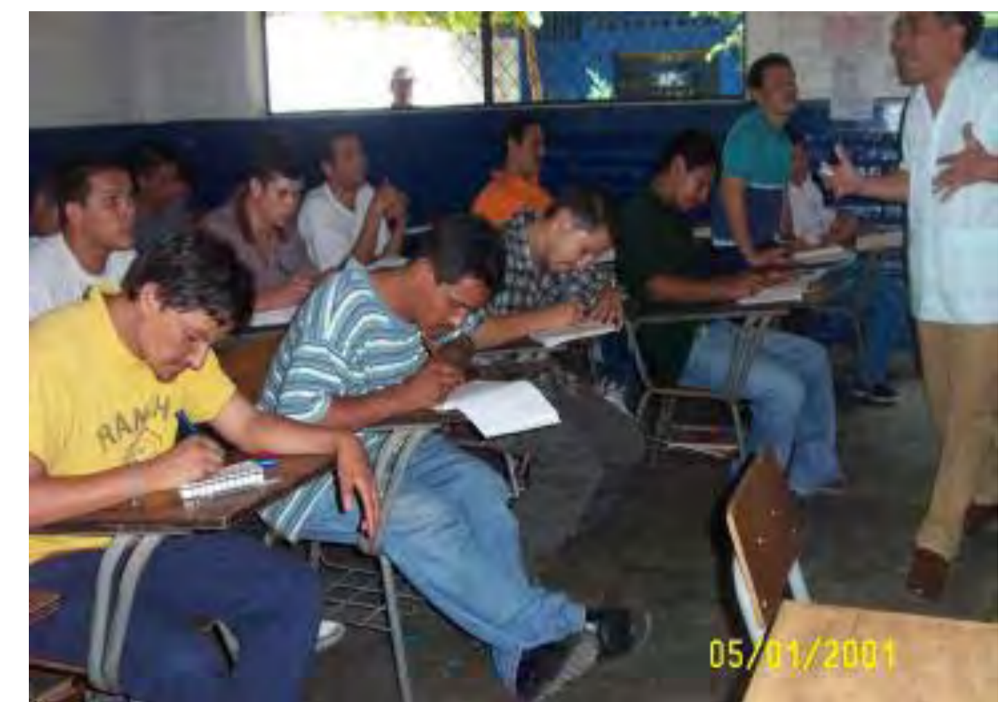
Charlas de desarrollo humano

En Los Angeles han logrado involucrar en el programa aprox. a 600 jóvenes , e indirectamente, a través de pláticas y conferencias a unos 5000 jóvenes más.