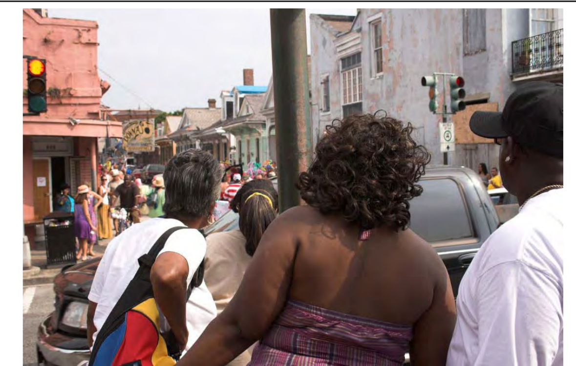
La calle 18 en Rampart, Los Ángeles - aquí se fundó la Mara 18

así por la calle 18 en Rampart (imagen) en un barrio de Los Ángeles). Este grupo de maras antes tenía una mixtura étnica y un líder mexicano. La segunda más conocida es la Mara Salvatrucha que al principio estaba conformada por salvadoreños y fue fundada en el Seoul International Park, un parque en Los Ángeles.