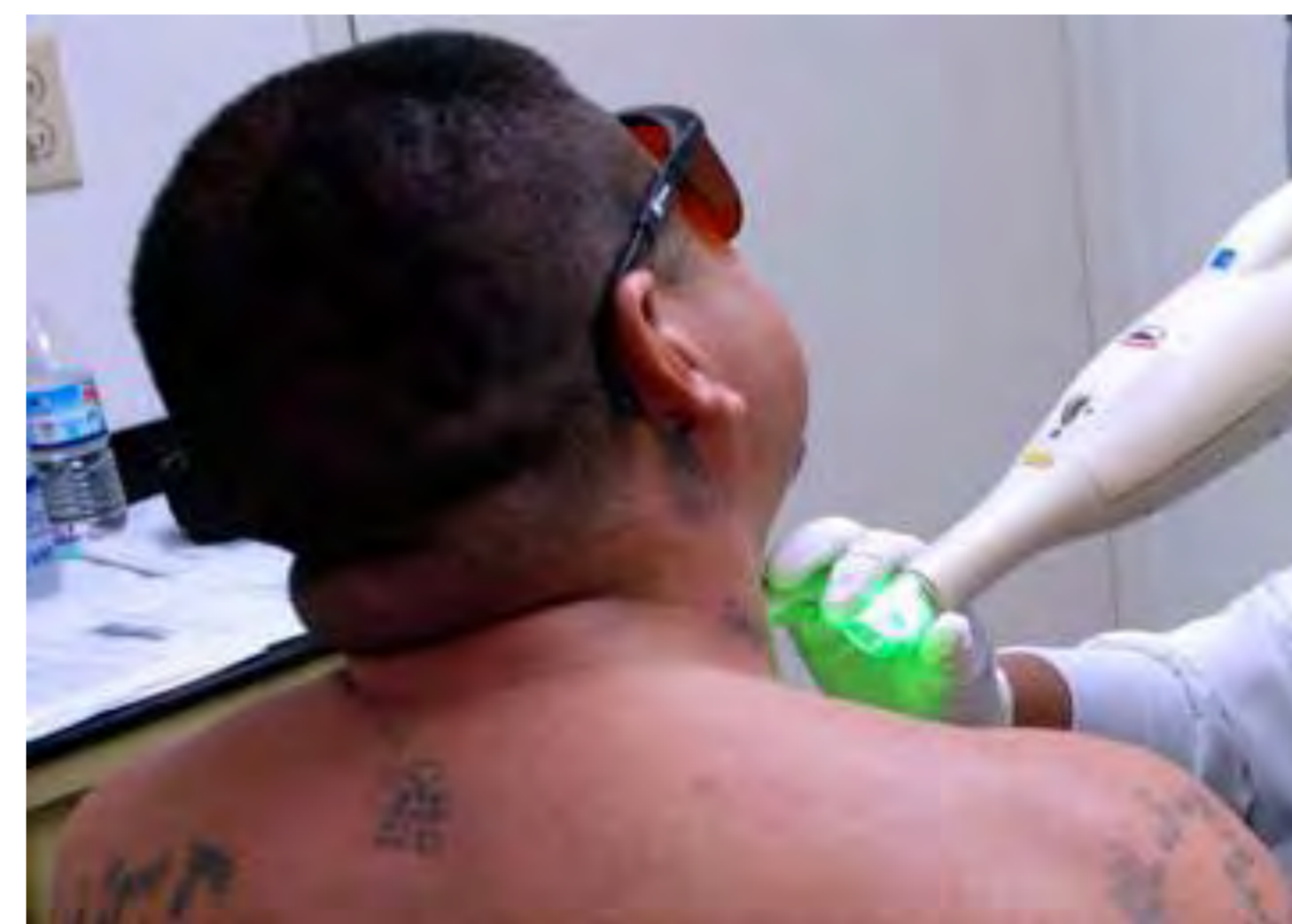
Remoción de tatuajes para que se puedan reintegrar en la sociedad

Homies Unidos fue fundada en 1996 en El Salvador por mareros rivales . Se reunieron para buscar soluciones para una vida mejor sin violencia. Desde entonces se han unido muchos pandilleros inactivos. Ellos mismos integran la junta directiva. Ninguno de ellos ha tenido educación formal para dirigir programas de intervención con pandillas, sin embargo son ellos quienes logran acercarse a los pandilleros porque comparten las mismas historias de vida.