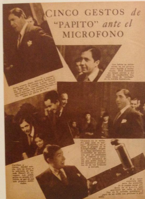
Sintonía, n.º 20, 1933, Buenos Aires